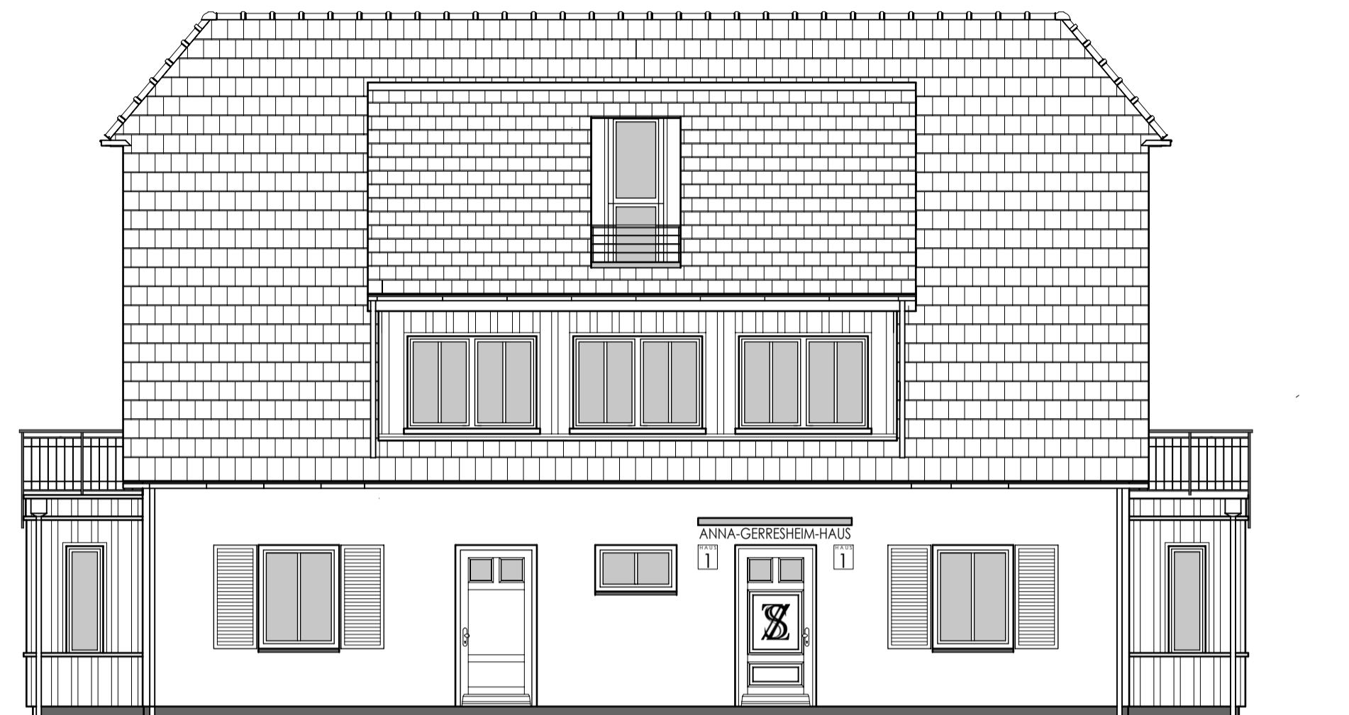
Nord - West - Ansicht