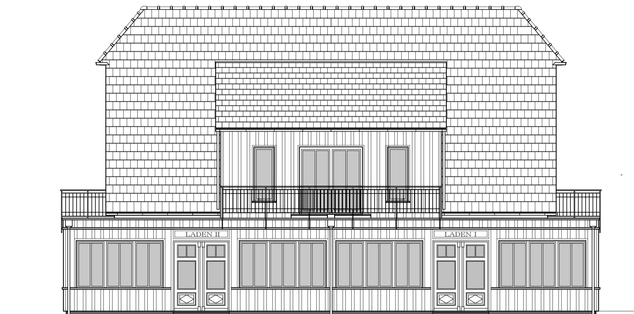
Süd - Ost - Ansicht